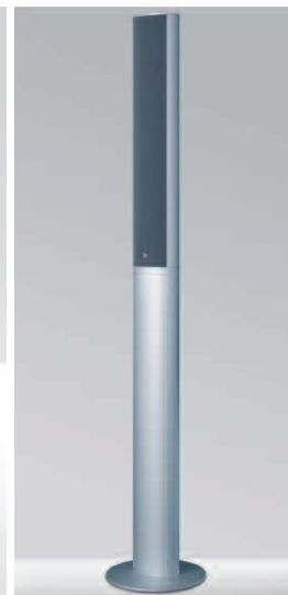
Optional 'Bass Extender' bass enhancing stand for HTS6001